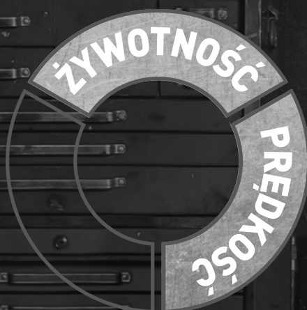
Konwencjonalna ściernica Norton