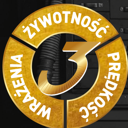
Ściernica Norton Quantum 3