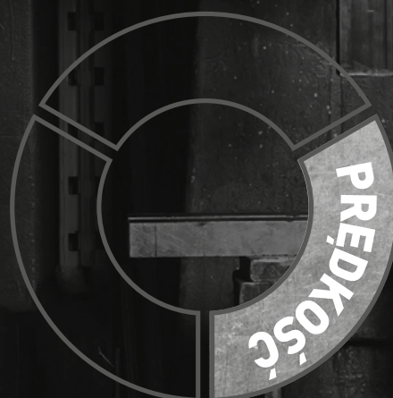
Ściernica cyrkonowa Norton